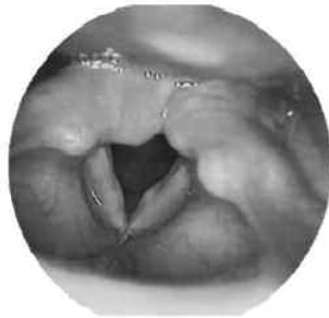
Kissing nodules

La plupart du temps, il s'agit de kissing nodules, avec la classique fuite d'air en sablier. La stroboscopie nous aide bien à différencier un nodule d'un kyste intracordal pour lequel la vibration est souvent perturbée, voire interrompue, à l'endroit de la lésion.