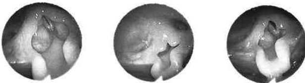
Vue endoscopique d'un larynx d'enfant de 2 ans (clichés personnels)

Le larynx du nouveau-né (Heuillet-Martin et coll., 1995) est proportionnellement plus petit que celui de l'adulte, quand ses cordes vocales sont proportionnellement plus larges et plus courtes que chez l'adulte. Elles mesurent, à la naissance, 5.5 mm chez le garçon et 4.5 mm chez la fille, et vont croître en permanence pour atteindre 10 mm vers 10 ans. Entre 10 ans et l'âge de la puberté, leur développement est plus important chez le garçon : c'est la mue. Par ailleurs, l'épaisseur de la partie membraneuse de la corde vocale diminue tout au long de la croissance, pendant que la partie vibrante augmente. Les bandes ventriculaires sont aussi plus volumineuses chez le nouveau-né et peuvent même masquer les cordes vocales, elles vont s'affiner et s'écarter pour laisser les cordes bien apparentes.